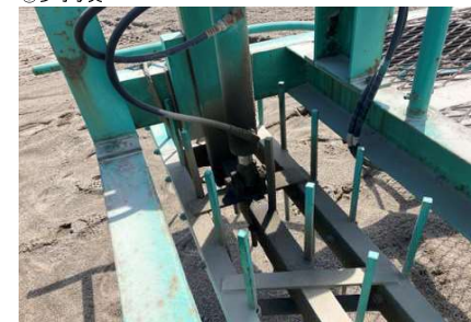
後方爪ハローの昇降用油圧シリンダーの油漏れあり