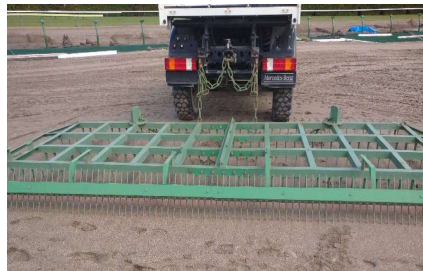
特にフレーム腐食、歪みはありません