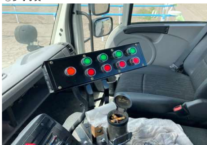
油圧操作盤と電源スイッチ

(本体に付属していないので別途購入する必要がある) 油圧で稼働する部分は、本体移動用車輪の昇降、前方爪ハローの昇降、後方爪ハローの昇降