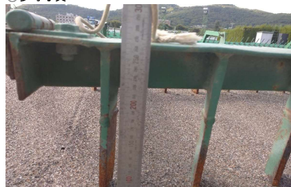
前爪長さ260mm程度 後爪長さ225mm程度