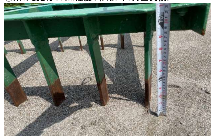
② 爪の長さは30cm程度(令和3年5月全交換)