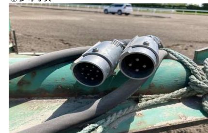
油圧稼働用電源ソケット部(右側)、油圧操作盤ソケット(左側)