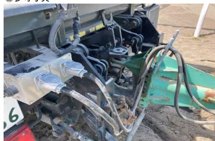
牽引は1カ所、油圧稼働用電源コード1本、油圧操作コード1本