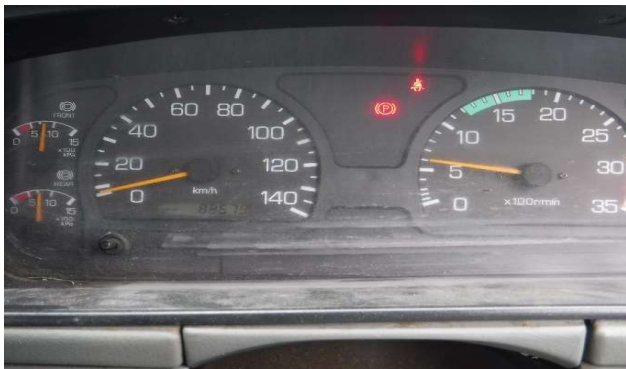
⑪計器類状況 走行距離88,679km