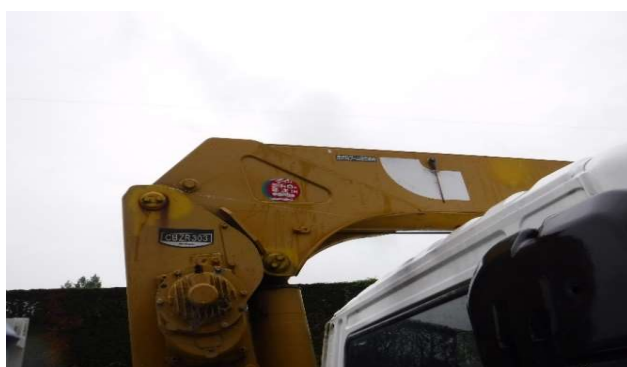
⑦小型移動式クレーン特定自主検査(有効期限 2020年5月期限切れ)