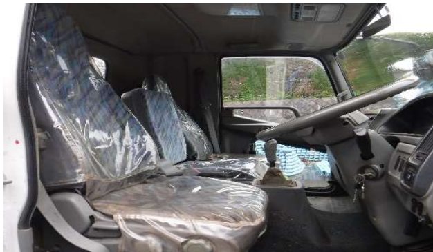
⑬車内状況 シートカバー・フロアマット一部破損