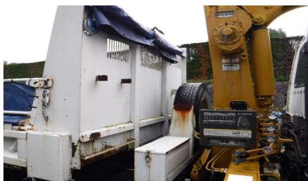
⑥予備タイヤ・工具入れ・スコップ掛け・シート装備