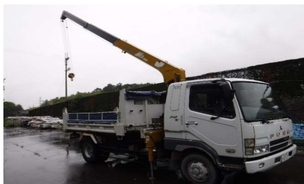
⑧クレーンブーム伸長状況 最大作業半径7.5m