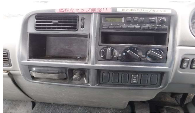
⑫エアコン・ラジオ装備