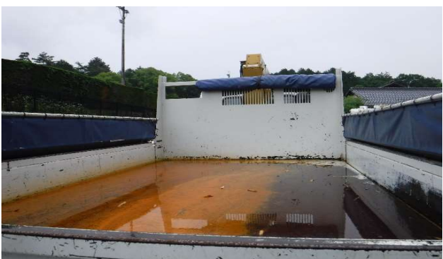
⑤外観(荷台) 経年劣化により荷台一部腐食あり