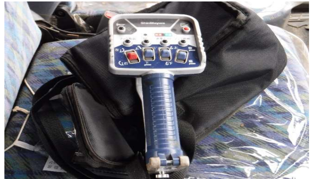
⑩小型移動式クレーンリモコン装備