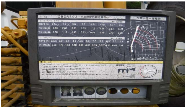
⑨吊上げ荷重2.9t 最大作業半径7.5m